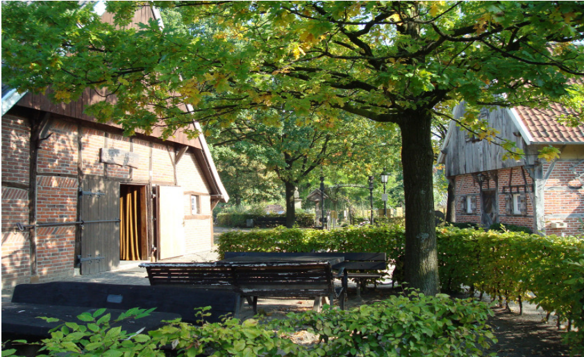
Heimathaus mit Backspieker und Apothekergarten

Heimathaus – Olthoff – Heddier – Schulze Bröring