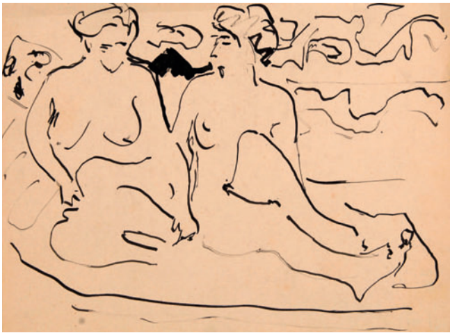
Zwei Akte im Atelier, Feder in Tusche, um 1908.