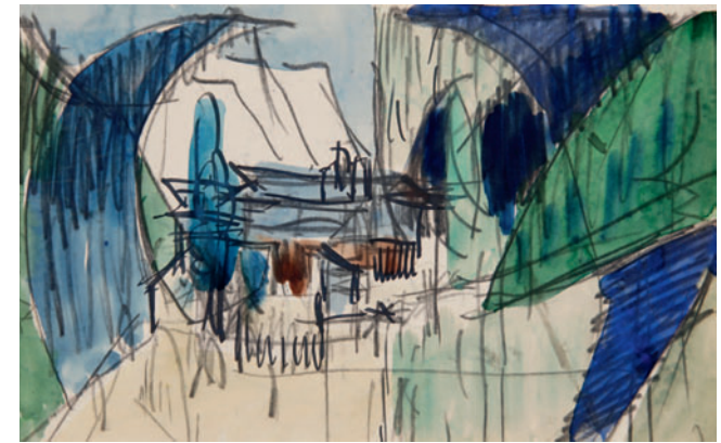
Landschaft mit Haus, Aquarell, Bleistift und Tusche auf Velin, 1938.