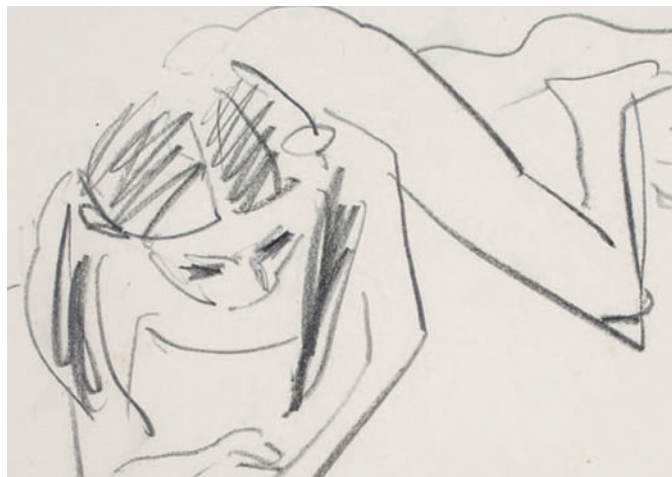
Liegende Fränzi, Schwarze Kreide, um 1910, Detail.